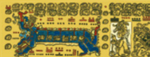
Detall del Còdex de Dresden amb Itzamná a la boca del drac celestial.

Els maies tenien un complex sistema d'escriptura que combinava logogrames i glifs sil·làbics, similars als de l'escriptura japonesa.